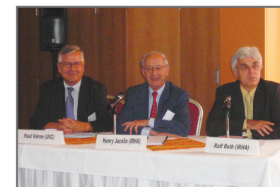
Bratislava Conference 2009

Chile (2013), Austria (2014), United States, Nigeria, France